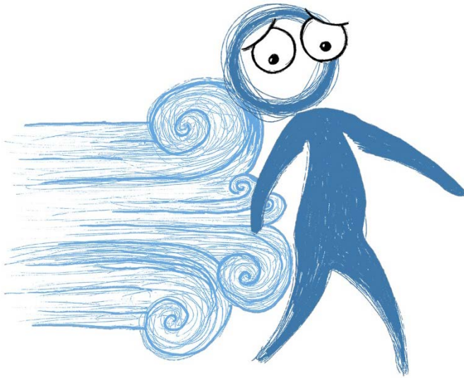
Illustration af PUSH-effekter

Hvilke personlige forhold kan du forestille dig, der kan 'skubbe' folk mod at blive del af et ekstremistisk fællesskab? Skriv dem direkte på figuren eller på linjerne nedenfor: