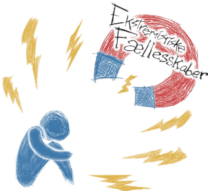
Illustration af PULL-effekter

Hvilke elementer af et ekstremistisk fællesskab kan du forestille dig, der kan virke tiltrækkende for nogle mennesker? Skriv dem direkte på tegningen eller på linjerne nedenfor: